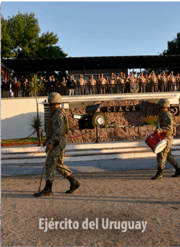
Ejército del Uruguay