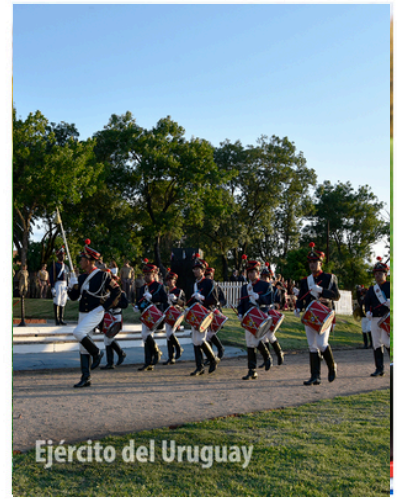
Ejército del Uruguay