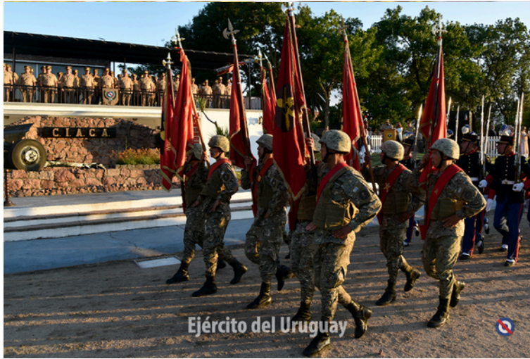
Ejército del Uruguay