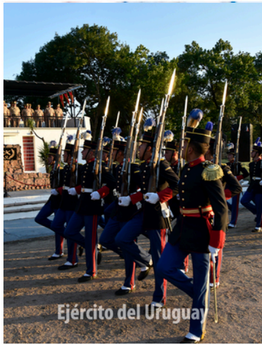
Ejército del Uruguay