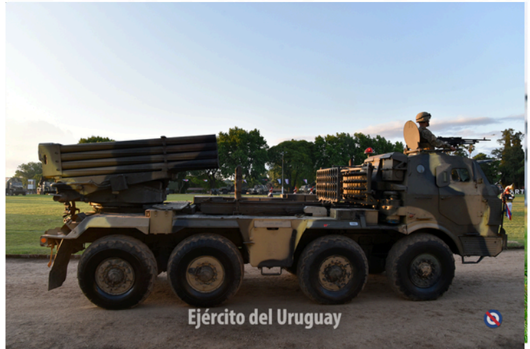
Ejército del Uruguay