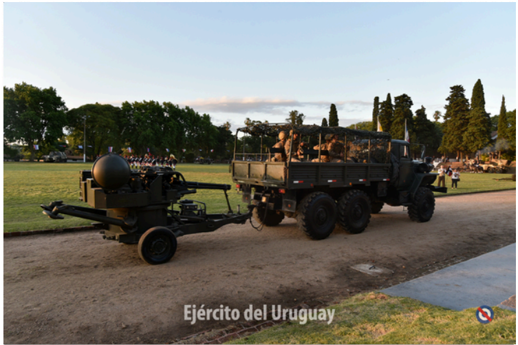
Ejército del Uruguay