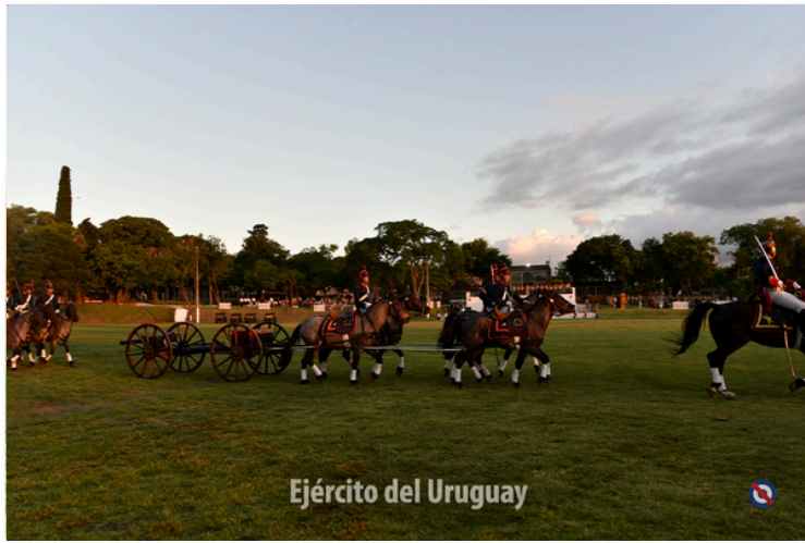
Ejército del Uruguay