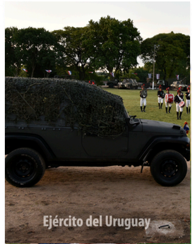
Ejército del Uruguay